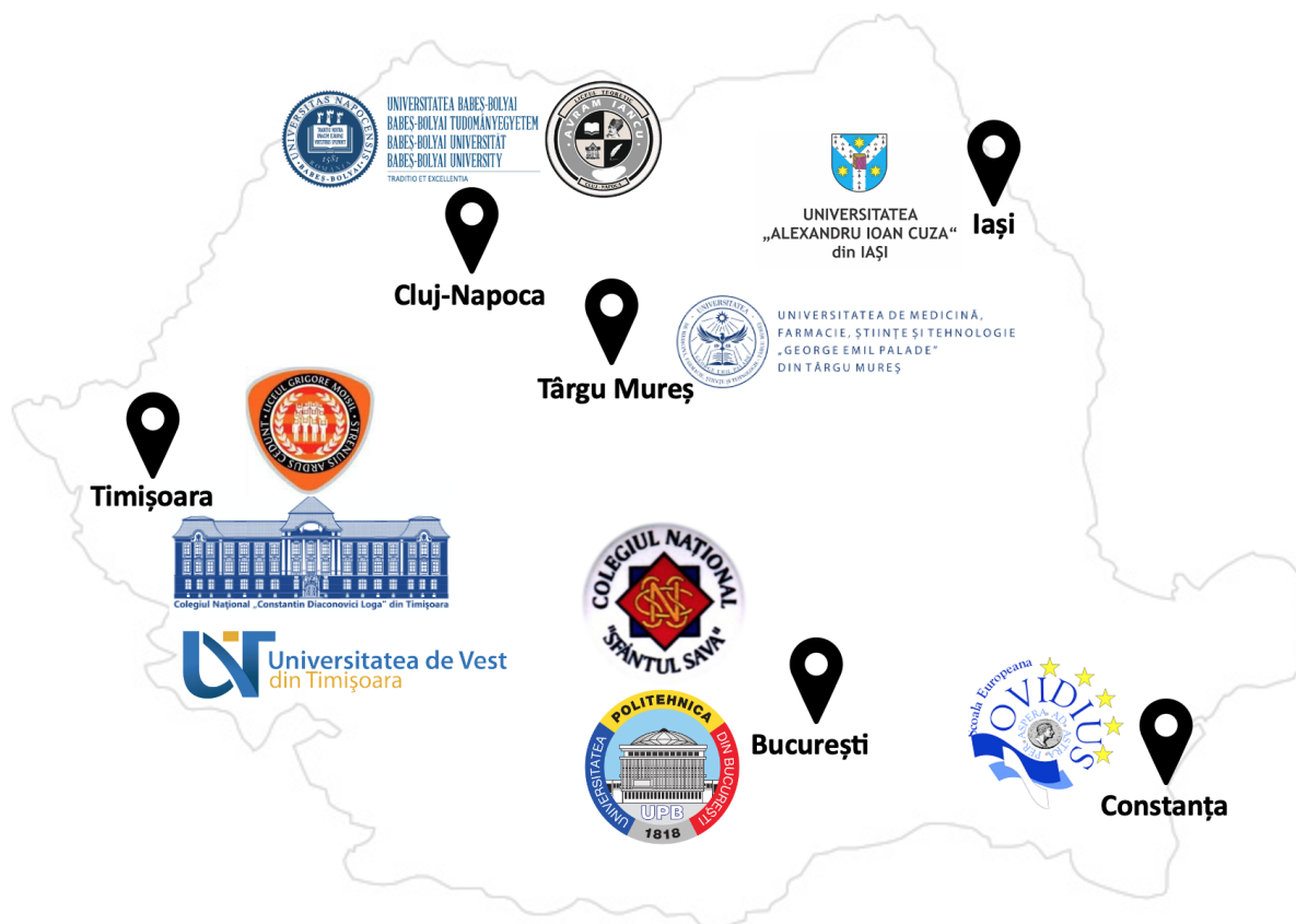
Harta instituțiilor preuniversitare și universitare partenere

Facultatea de Chimie, Biologie, Geografie, Universitatea de Vest din Timișoara